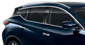
Темно-синий — RBG