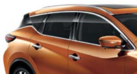
Оранжевый — EAW