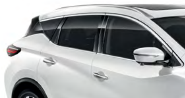
Белый перламутр — QAB