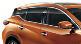
Оранжевый — EAW