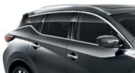
Темно-серый — KAD