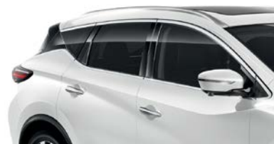
Белый перламутр — QAB