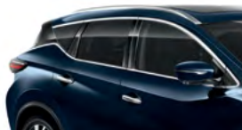
Темно-синий — RBG