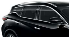
Черный — G41