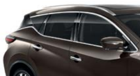
Серо-коричневый — CAM