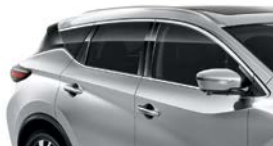
Серебристый — K23